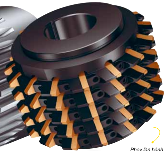
Phay lăn bánh răng biên dạng tinh CoroMill® 176 mới.