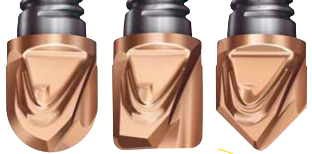
Mũi cầu, bán kính góc và mặt vát.

Với giao diện iLock đảm bảo độ chính xác và ổn định, dao phay này rất dễ sử dụng và được sản xuất với cấp chất lượng B theo tiêu chuẩn DIN3968.